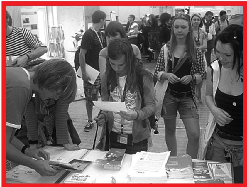
Regel Besucherandrang am CDL-Stand beim evangelischen Kirchentag in Dresden Anfang Juni 2011

Dieses wichtige Manifest, das auch von der Jungen Union ausdrücklich unterstützt wird, ist auf der Webseite der Senioren-Union und der CDL unter www.cdl-online.de zu finden.